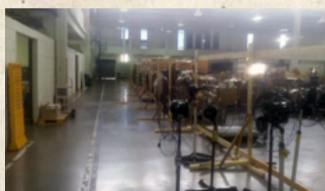
Sintcom-PR acompanha andamento das obras no CTCE Londrina