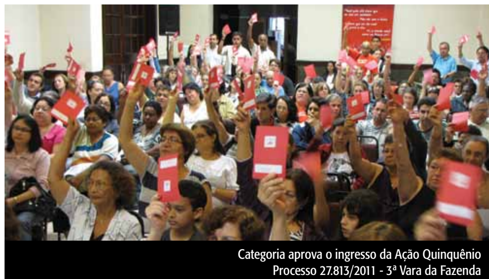
Categoria aprova o ingresso da Ação Quinquênio Processo 27.813/2011 - 3ª Vara da Fazenda

Em maio último, a assessoria jurídica do SindSaúde ingressou com mais ações. Uma delas reclama o direito de o quinquênio seja pago sobre o valor resultante da soma do salário-base mais a GAS, hora extra e outras vantagens, como adicional noturno, plantão médico etc. Não mais calculado apenas sobre o salário-base como é feito atualmente.