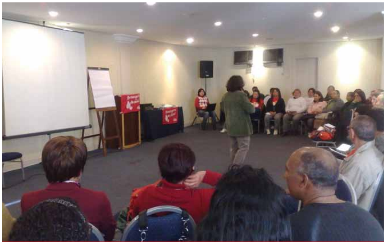
Categoria aprova, em assembleia, ingresso da ação

Há muito tempo criou-se a necessidade de ter conta bancária. Da necessidade dos usuários ao lucro de quem conseguiu ter uma instituição financeira, o Bradesco - maior banco privado brasileiro - só no primeiro semestre desse ano obteve lucro de 161,6 milhões de dólares. Já o Itaú, o segundo da lista, também lucrou a módestia quantia de 125,7 milhões de dólares no mesmo período. O lucro do Unibanco também é digno de registro. Nada menos que 40,7 milhões este ano. Com essas cifras, se entende as razões pelas quais há tanta taxa para executar qualquer transação financeira e por que incentivam os trabalhadores a fazer empréstimos. A pobreza nossa de cada dia se transforma na riqueza dos banqueiros.