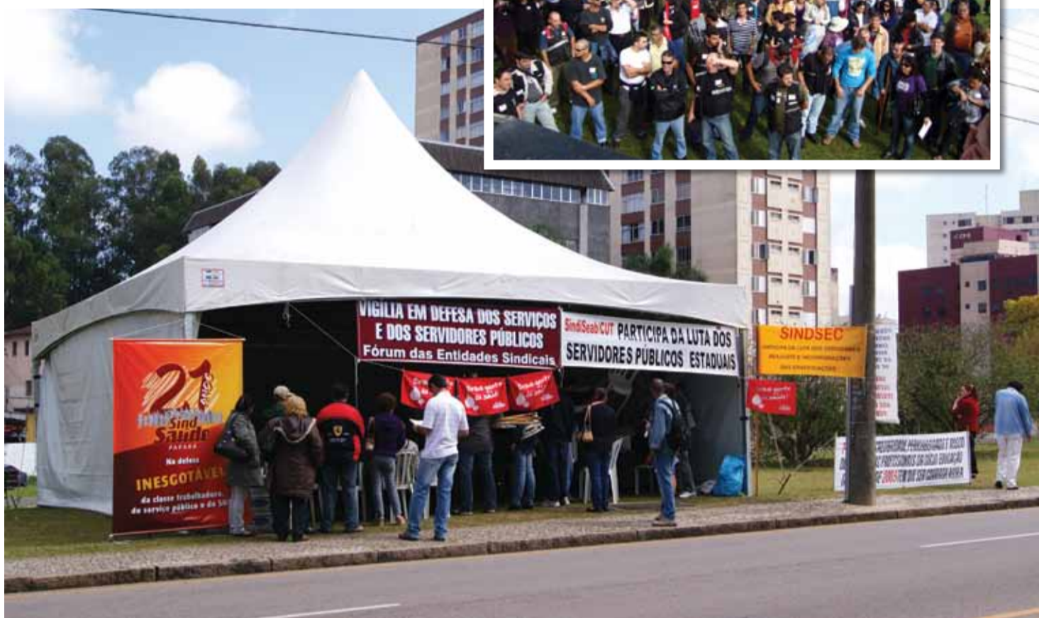
Participação destacada na luta conjunta do FES em 2010

O SindSaúde não vai aceitar arrocho para a categoria. Por isso, a indignação com o possível congelamento do salário dos servidores não pode ser restrita ao local de trabalho ou à casa de cada um. Fique de olho na agenda e participe!