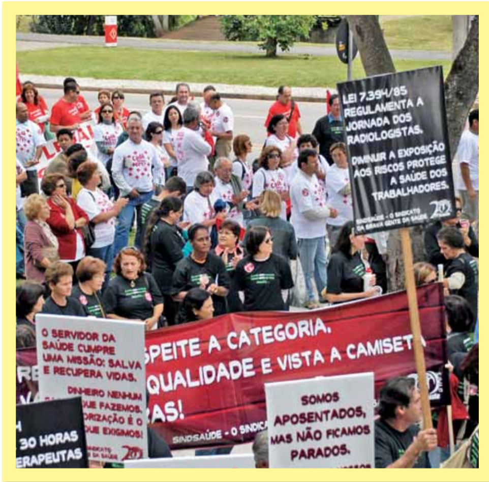
Março de 2009. Categoria mostra união e indignação

Em 1994, começa o governo Lerner. Foram oito anos de perdas significativas, além da desestruturação dos serviços públicos e das privatizações.