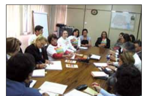
Reunião entre Sesa, dirigentes do sindicato e categoria

Exemplo - Mesmo com a tragédia que arrasou o Litoral do Estado, uma delegação de 13 pessoas veio de Antonina se somar ao restante da categoria para reivindicar o que é de direito. Um exemplo para os servidores e servidoras que ficam em casa, na esperança de que as conquistas