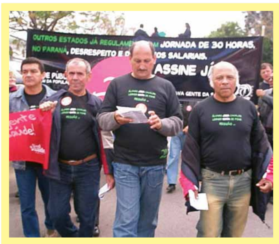
1º de Maio. Mais uma data para a brava gente soltar a voz.

A partir de 2003, outros desafios se apresentaram. O sindicato chama a categoria para lutar pela implantação da GAS. Com muita garra, a brava gente adere a essa luta e consegue, depois de muitos meses de protestos e mobilizações, a implantação da gratificação.