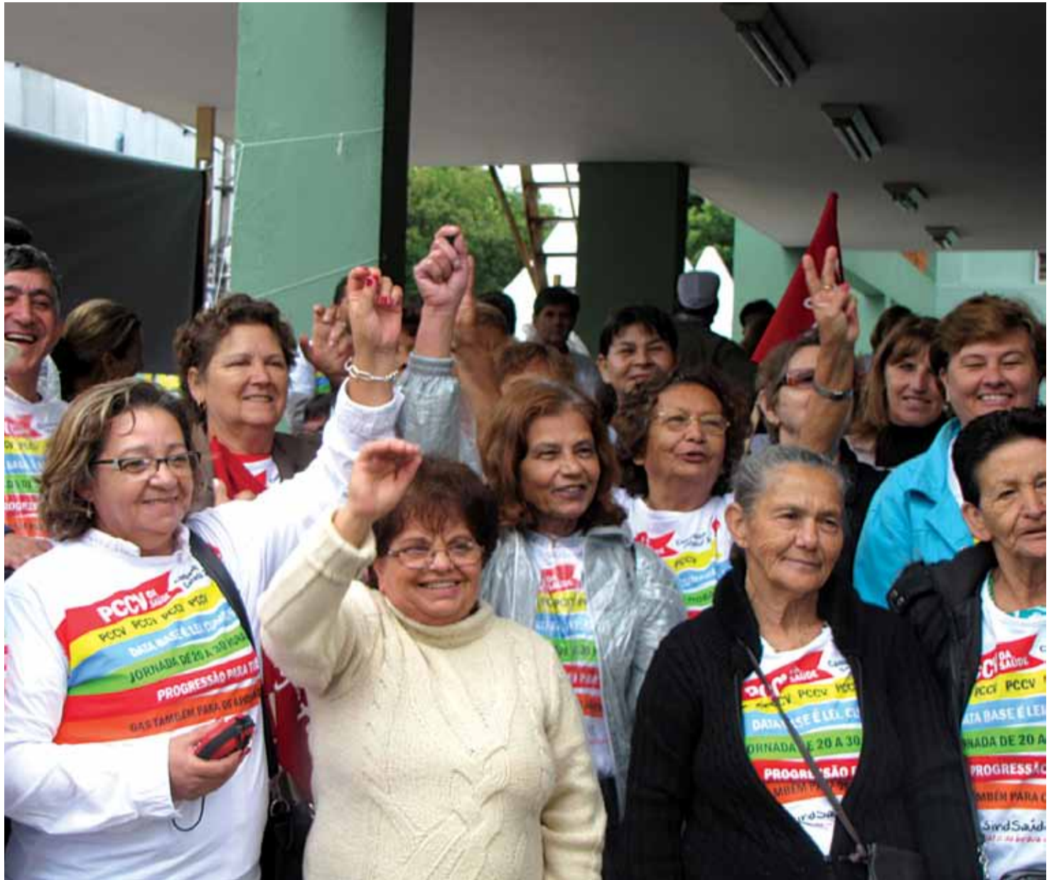
Gente sábia que foi dia 30 de março reivindicar direitos

Os aposentados têm apenas uma revisão anual do salário. É na data base. Por isso, a importância do cumprimento da lei de reposição anual, disposta na Constituição Federal e em lei estadual.