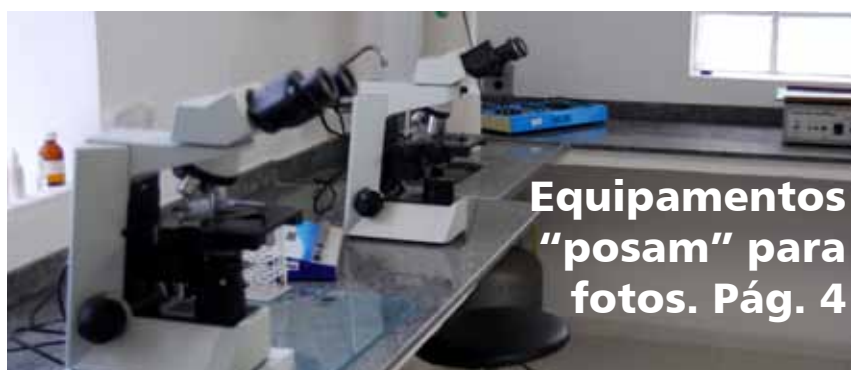
Equipamentos "posam" para fotos. Pág. 4

Recursos para brindes e almoços têm de ser ressarcidos. Pág. 3