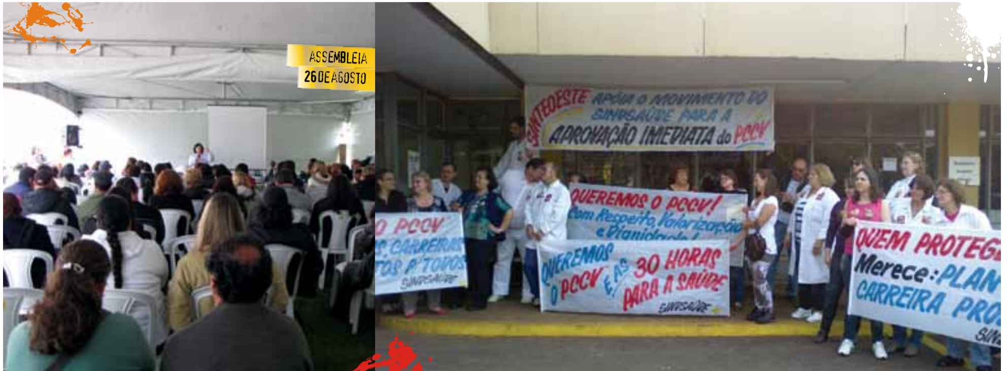
ASSEMBLEIA 26 DE AGOSTO

A direção sindical encaminhou à Sesa proposta de projeto de lei que regulamenta a jornada de trabalho dos servidores da saúde. A iniciativa apenas cumpre decisão da assembleia da categoria, realizada no dia 26 de agosto.