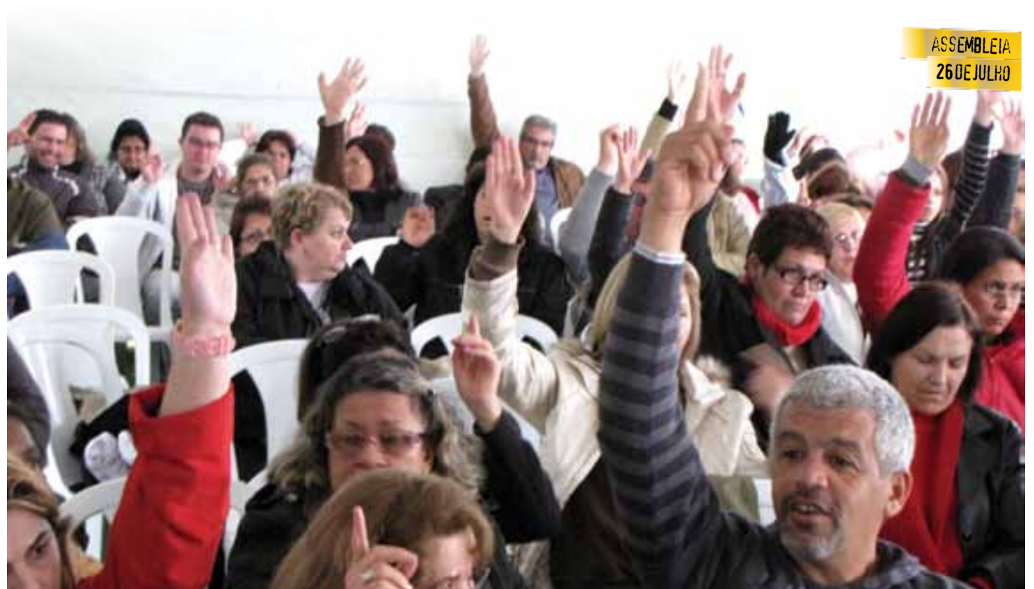
ASSEMBLEIA 26 DE JULHO

Os trabalhadores também deliberaram pela realização de paralisações relâmpago até o final de setembro, quando ocorrerá nova assembleia.